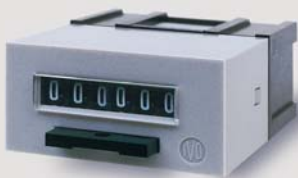
compteur de courses