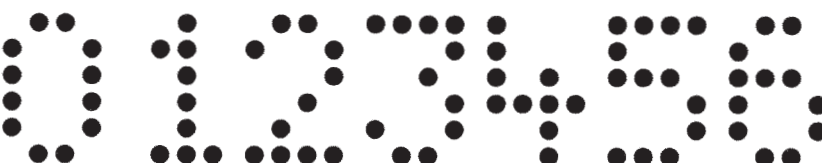
20 mm, matrice 4 x 6, Ø d'aiguille 2,3 mm